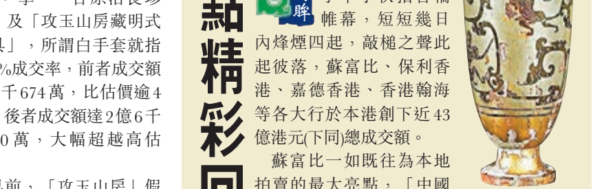
青銅鎔銀瑞獸紋杯

本月4日香港瀚海率先舉槌拉開了本年秋季拍賣帷幕，短短幾日，起起落落，蘇富比、保利香港、嘉德香港、香港翰海等各大行於本港創下近43億港元(下同)總成交額。