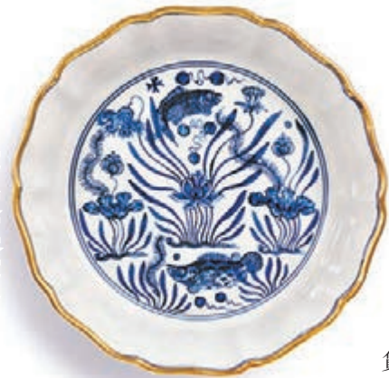
明宣德青花魚藻紋葵瓣花式洗

在面對通貨緊縮、經濟下行壓力，香港一眾收藏家、投資者對古玩藝術品市場仍有信心和熱心，借蘇富比及其他各行的秋拍大舉入市，由於有他們的支持使到首輪秋拍依然持續好戲連台。