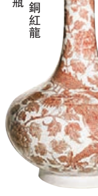
乾隆銅紅龍紋直頸瓶

本報自創刊以來得到了廣大讀者的歡迎和支持，現向眾要求特闢「釋疑解難」專欄，如讀者收藏的古瓷藝術品有何疑難，可將物件拍攝成圖片電郵至：stfung@wenweipo.com，我們將有專家作解答，敬請垂注為荷。