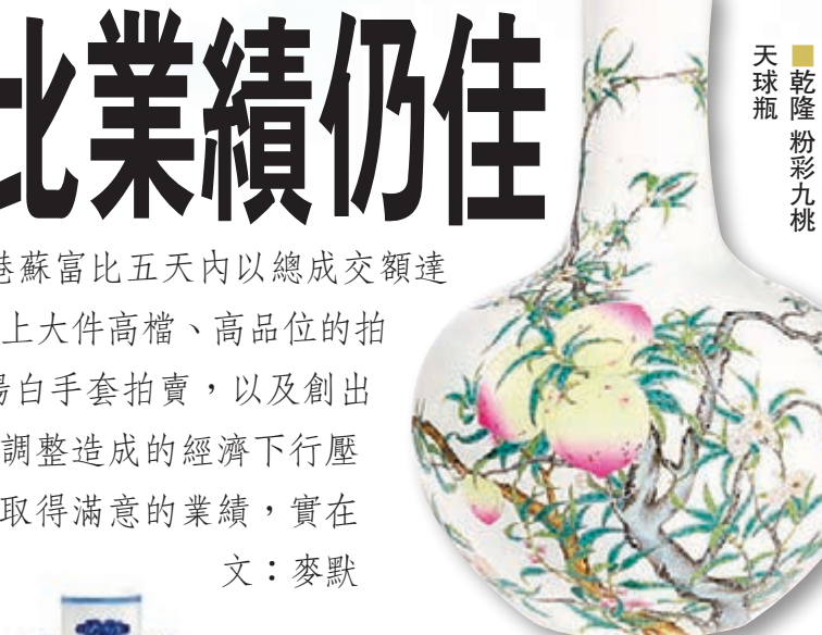
乾隆青花礬紅海水龍紋扁壺

大藏家仇焱之舊藏的南宋官窯小杯，口徑僅7.5cm卻以968萬被買家捧走。此小杯簡約悅目，釉色溫潤如凝脂，金線線開片疏朗自然，可謂舉世稀珍。南宋官窯，出品於當朝都城臨安，即今天的浙江杭州，專供皇室御用而製，簡潔端莊，享負盛名，可謂上品重器。宋官窯舊時成品已少，如今傳世更屬罕有。細觀此杯釉色略偏粉