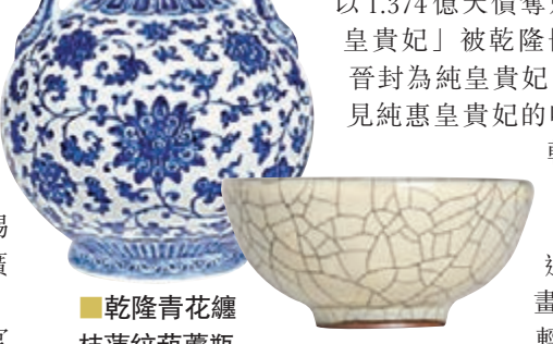
乾隆青花纏枝蓮紋葫蘆瓶