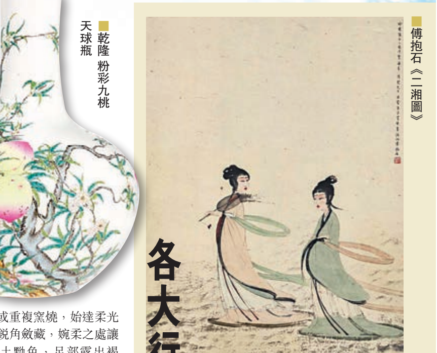
乾隆粉彩九桃天球瓶