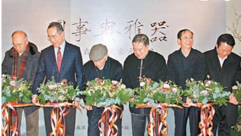
▲一眾嘉賓為「閑事與雅器」展覽剪綵。

本版的1月號已將預展時的展品作過介紹，本期着重寫正式開幕的盛況，特別是論壇的所受到超乎熱情的追捧。