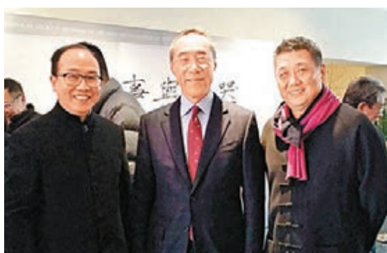
▲唐英年蒞臨作剪綵嘉賓，與翟健民、麥溥泰合影。

外，400座位不敷應用，主席台上僅留空演講者周邊位置，其餘所有空間都讓給聽眾」。此言一出，站在前面的聽眾捷足先登，紛紛有序地坐上了主席台，至此台上台下包括通道都或坐或站有逾千聽眾，可見北京人的求知熱情和優秀的人文質素。