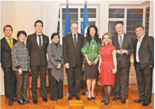
▲眾嘉賓於酒會上合照留念