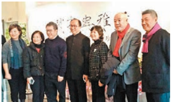
▲各方人士到賀合照留念