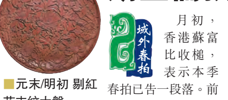
■ 元末/明初剔紅花卉紋大盤

值得關注更有一尊18世紀銅鑲金大紅司命主像，這尊司命主紅色火焰狀髮髻豎起，毗露獠牙，表情凶憤，極具威懾力。其身着盔甲，腳踏高靴，弓步站立於蓮花座上，生動寫實。全像刻畫生動飽滿，鑲金濃郁璀璨，為難得的造像藝術品。