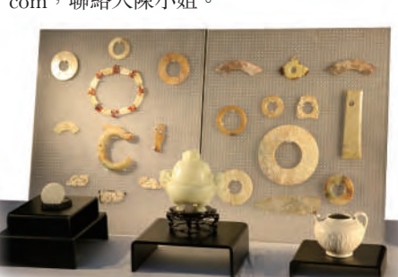
■ 北京嘉賓在酒會上展示的古玉

電話：+852 2548 8702，傳真：+852 2559 8568，電郵：info@chaksinvestment.com，聯絡人陳小姐。