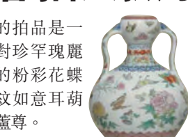
■ 乾隆粉彩花蝶如意耳葫蘆尊一對