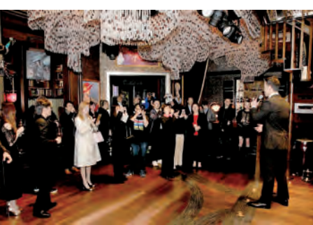
■ 場面豪華的上海酒會