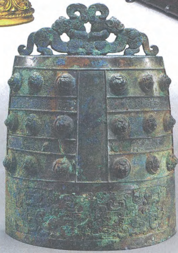
戴克成（巴黎） 東周 公元前五世紀 青銅鐘 高：29.3公分