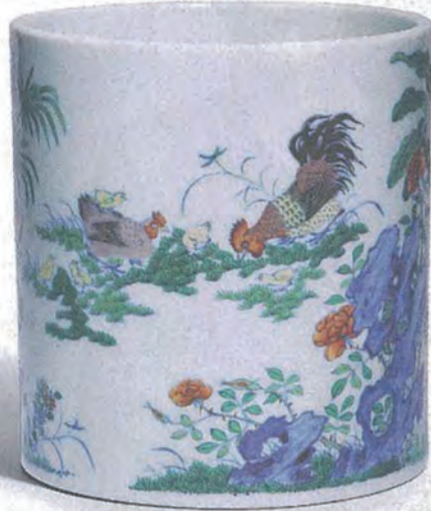
·世界華人收藏家學會珍藏展· 清乾隆鬥彩雞缸筆筒 高：13.4公分 直徑：12.3公分

由本港翟氏投資有限公司主辦，每年一度的「香港國際古玩展」，到今年已踏入第十屆，將於5月26至30日假香港會議展覽中心展覽廳舉行。今年繼續有西方古玩，亦新增油畫及腕錶作品；除了提供一個高質素的交流平台之外，更以提升公眾人士對古玩藝術的興趣為己任。今期精英薈邀得國際古玩展的管理人翟凱東先生（圖右）作訪問，估不到年紀輕輕的翟凱東，對古玩的熱情不比前輩淺，多年來為國際古玩展引入不少新穎元素，希望大家知道：「古玩」一是可以很有趣！