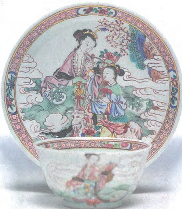
桑托斯—倫敦（英國） 清雍正中國外銷瓷粉彩茶盤及茶托