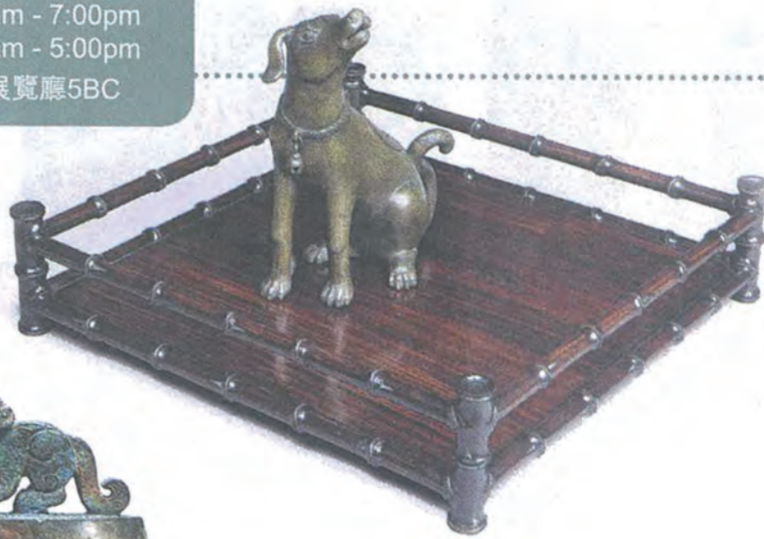
Fleurdelys Antiquités（英國） 19世紀 紅木仿竹節紋方盤 尺寸：35 × 35公分 高：9公分 明 銅犬香薰 高：20.5公分