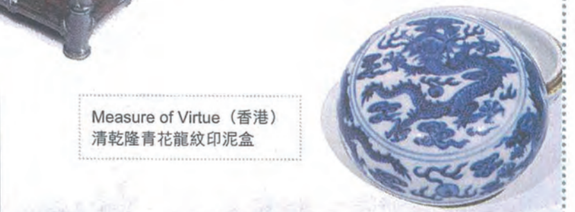
Measure of Virtue（香港） 清乾隆青花龍紋印泥盒