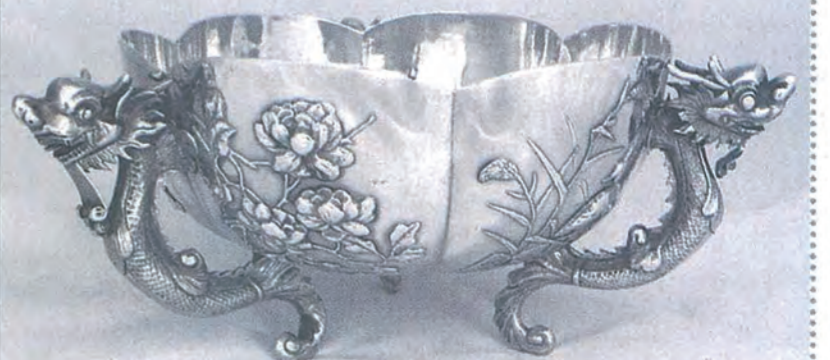
Esme Parish Silver（新加坡） 19世紀晚期 外銷龍耳銀盆（香港製） 直徑：19公分