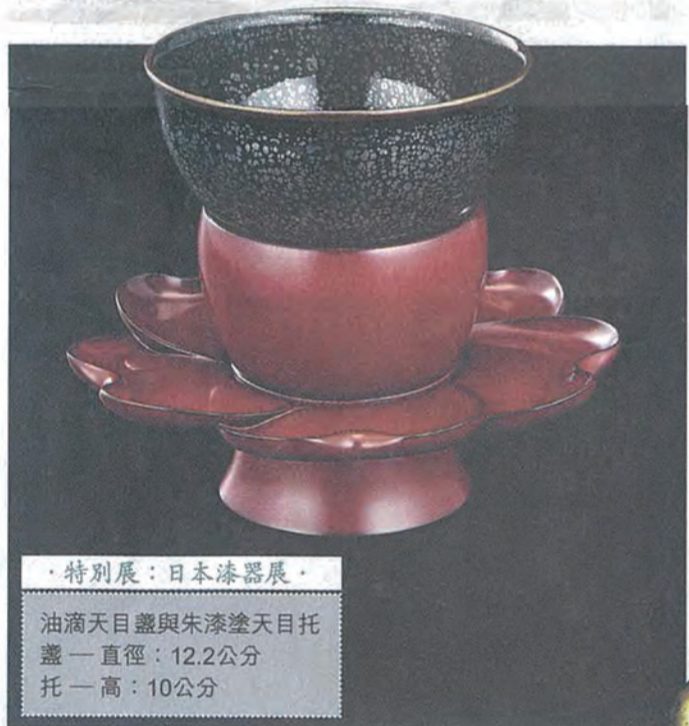
·特別展：日本漆器展· 油滴天目盞與朱漆天目托 盞一直徑：12.2公分 托一高：10公分

師承父親翟健民是古董界老行尊，其獨特看法——「將有價值的古董交予有緣人」對翟凱東影響尤深。在不同的古董類型中，翟凱東對瓷器情有獨鍾，他解釋：「爸爸是研究瓷器的專家，主要在爸爸身上學習有關瓷器的鑑賞；至於其他古董例如佛像、銅器及玉器等，就是從媽媽身上學習。」原來翟凱東母親劉惠芳女士亦是生於古董世家，難怪兒子對古董收藏有如此幹勁。