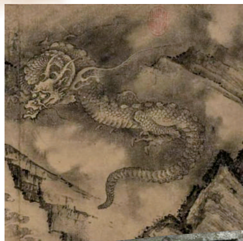
南宋陳容《六龍圖》局部(紐約佳士得)