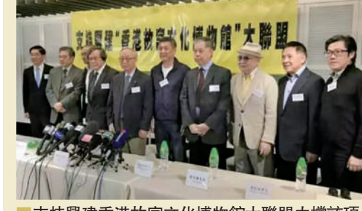
支持興建香港故宮文化博物館大聯盟力撐該項目

大聯盟的努力得到認同，如今，興建香港故宮文化博物館合作協議已塵埃落定，珍貴的中華文化藝術瑰寶將擴闊西九文化區的文化領域，亦必然提升香港作為文化勝地的吸引力，從而鞏固香港作為文化大都會的領先地位。