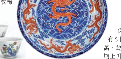
雍正青花礬紅彩海浪紋九龍圖大盤(北京保利)

佛像拍賣在近幾年非常熱，一尊明永樂鑲金銅釋迦牟尼佛坐像以逾2億成交，刷新中國雕塑的世界拍賣紀錄。「中國宮廷御製藝術精品」專拍，不少宮廷瓷器皆有可喜表現，明洪武龍泉青釉菱花大盤以486萬成交。另一件乾隆「粉彩嬰戲圖罐」存世罕有，最終成交1,446萬，超過低估價兩倍有餘。