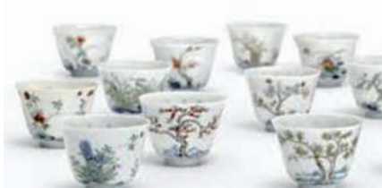
康熙五彩花神盃(北京保利)

紐約蘇富比的「明·國風」專場，14件明宮廷珍品備受矚目，拍出13件以超預期高收益收槌。其中：永樂甜白釉暗花纏枝牡丹紋梅