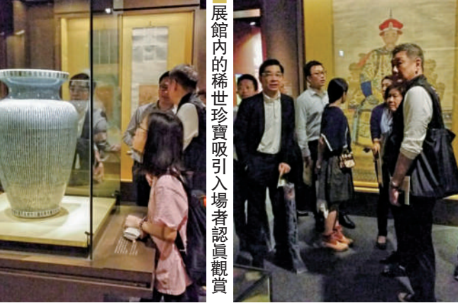
展館內的稀世珍寶吸引入場者認真觀賞