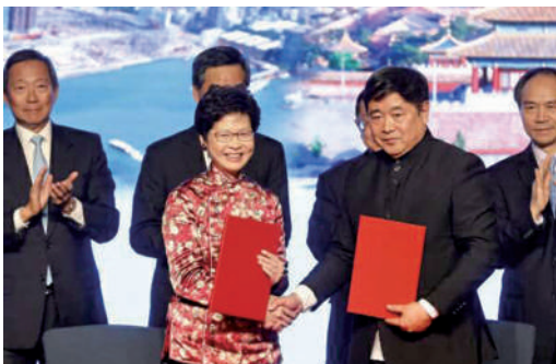
香港故宮文化博物館合作協議成功簽署

在香港回歸二十周年的一系列慶典活動中，有一項文博、收藏、古玩藝術品業界最魂牽夢縈，最高興，最感欣慰的大事就是香港故宮文化博物館合作協議在國家主席習近平的關懷下成功簽署。習主席讚揚西九文化區規劃和香港故宮文化博物館建設，將豐富香港國際都會的文化內涵，增加中西合璧的城市文化魅力。