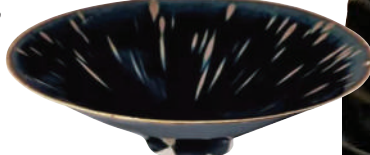
■ 北宋定窯黑釉鷓鴣斑碗

香港藝術品商會成立於1968年，至今已成為擁有數百名會員非牟利社團組織。一直以服務社會、促進工藝品行業發展、弘揚中華文化為宗旨，為會員及社會各界服務。會員包括經營或與古玩工藝品行業相關之商家、工廠、社團、拍賣公司及文物愛好者，其中不乏業界精英翹楚及名家名店。商會簽發的AB證（古玩鑒定證書），使同業的貨品出口到歐美、日本等地都享有免稅優惠。同業也一直通過商會，得以與內地的對口部門聯絡，方便購買貨品。